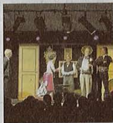
■ Ils ont joué "Le Prix Martin" de Labiche.

Conquis ! Que dire de plus quand on voit la qualité du jeu d'acteurs proposé vendredi soir aux Balarucois. La compagnie du Strapontin en choisissant de jouer sa pièce Le Prix Martin à Balaruc-le-Vieux ne s'était pas trompée. Le public largement réceptif ne pouvait qu'apprécier la prestation de ces acteurs et leur rendait bien. Rires et applaudissements en disaient long. Du grand Labiche apprécié par tous, même si pour la plupart d'entre eux, peu habitués à se rendre au théâtre, c'était une grande première. Pour le Strapontin qui jouait la pièce pour la troisième fois, il avait pourtant fallu quitter le confort de leur petit théâtre où ils ont l'habitude de se produire, peu importe. Le décor monté dans la