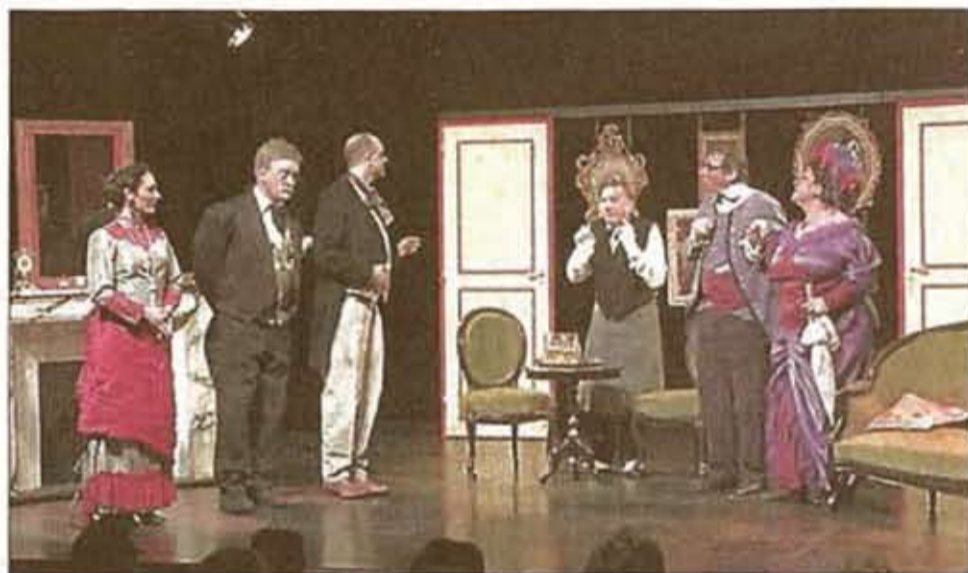
■ Une représentation donnée à guichets fermés.

Les comédiens allaient même jouer à guichets fermés. Les retardataires devront attendre une nouvelle représentation. Les acteurs allaient vite prendre leur marque sur scène face à un public curieux et réceptif de découvrir la dernière née. Jeunes ou moins jeunes, habitués de la compagnie ou nouveaux venus, ils tenaient absolument à être là.