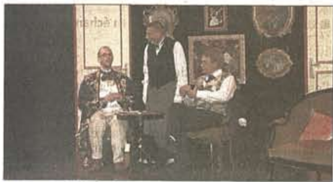
■ Une comédie burlesque à ne pas rater !

Les deux premières représentations du Prix Martin , une pièce de théâtre d'Eugène Labiche, mise en scène par Anne Mouraret, ont eu lieu il y a quelques semaines à Poussan. À cette occasion, les acteurs de la compagnie du Strapontin ont joué à guichets fermés, les deux représentations ayant attiré un large public, séduit par le spectacle. Ils avaient promis aux personnes déçues de ne pas avoir eu de place qu'ils auraient prochainement l'occasion de pouvoir